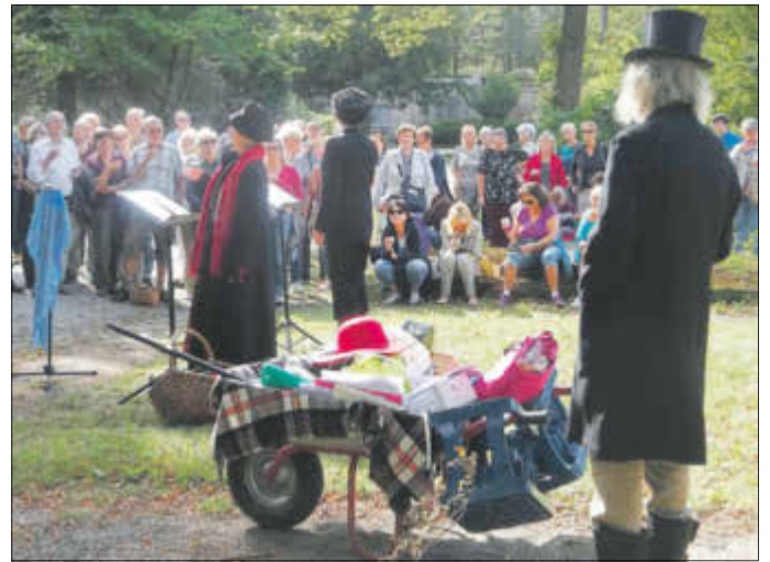
Eine Schubkarre voller Requisiten und ein Prost auf die russische Bestattungskultur“