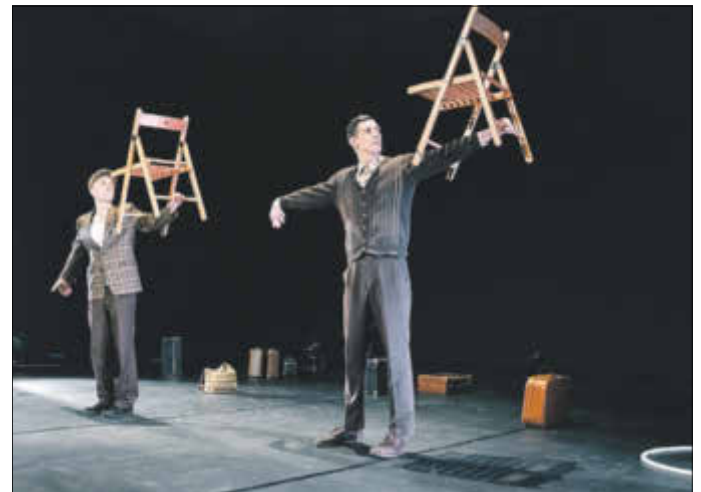
Spot The Drop ist Gast beim WinerViaThea im Kühlhaus

Anzeigenwerbung | Beilagenverteilung | Drucksachen