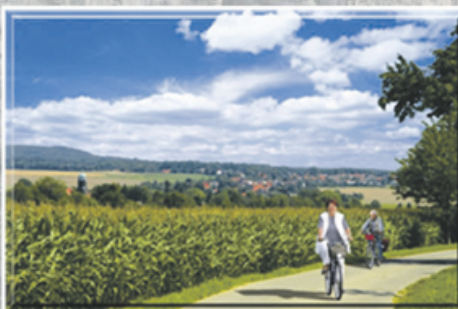
Blick auf Lohmen