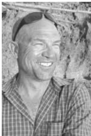
Die dreimonatige Radreise zu Beginn des Jahres 2017