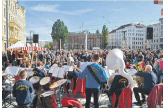
Gemeinsam erlebten viele Görlitzerinnen und Görlitzer an diesem schönen Oktobernachmittag ihren Postplatz neu.

Der Stadtbildverlag präsentierte sich mit Drucksachen zum Postplatz. Weitere Stände haben mit Informationen zur Bürgerbeteiligung und zur Engagierten Stadt